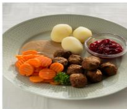
Äter man den här portionen får man 500 kcal och 17 gram protein