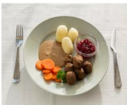
Äter man den här portionen får man 425 kcal och 13 gram protein.