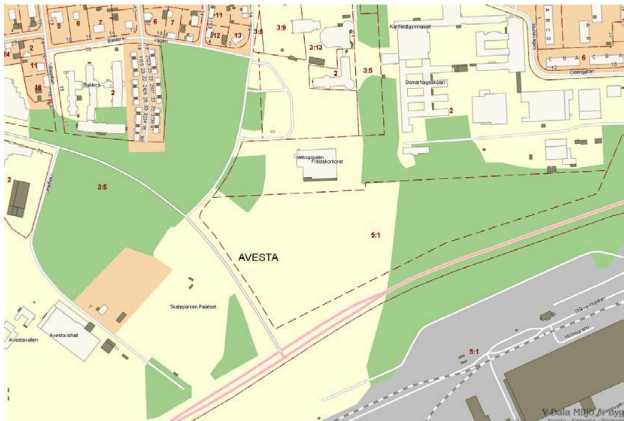
Bild 1. Kartbild över fastighetsgränser. Fastigheten Avesta 5:1 ägs av Outokumpu Stainless AB

Avesta kommun äger fastigheten som Metropoolen står på. Outokumpu Stainless AB äger fastigheten mellan Metropoolen och riksväg 68. Två detaljplaner finns upprättade för området. Varav den mest intressanta för motionen är Detaljplan del av Domarhagen 2 & Avesta 3:5.